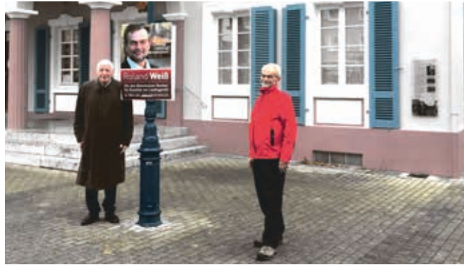
Fiktion, die so in der Gartenstadt seit mehr als 20 Jahren undenkbar wäre. Ein Wahlkämpfer wagt es, den Freyaplatz zu behängen. Der Zorn der Gartenstädterinnen und Gartenstädter wäre ihm gewiss und so ist dieses Foto als reine Fiktion dieser Tage entstanden.

Dieses Beispiel aufgreifend, so der Wunsch der FW-ML, soll nunmehr in jedem Stadtteil eine solche plakatfreie Zone entstehen. Die örtlichen Bezirksbeiratsgremien sind aufgefordert, die Vorschläge der FW-ML oder eigene Vorschläge dem Gemeinderat mitzuteilen. So könnte mit Hilfe der Plakatierungsrichtlinien in allen Mannheimer Stadtteilen quasi ein „Ensemble-Schutz“ für zu benennende Örtlichkeiten eingerichtet werden. Für einen Ensemble-Schutz hat die Fraktion der FW-ML folgende Ört-